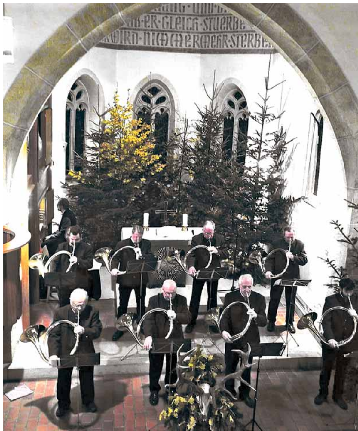
Jagdhörner sind Teil eines jagdlichen Brauchtums: Dazu gehören das etwas größere Parforcehorn sowie das handlichere Fürst-Pless-Horn (kleines Bild). Symbolfoto

Das Parforcehorn und das Fürst-Pless-Horn.