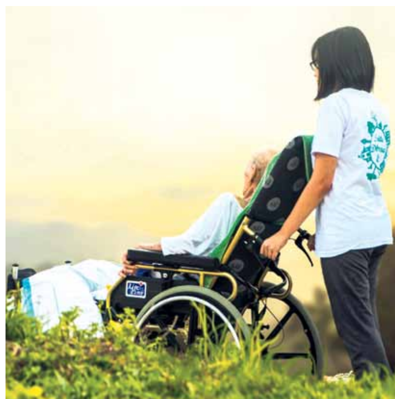
Der Fachkräftebedarf in den Bereichen Pflege und Handwerk ist eine Herausforderung für die Zukunft. Symbolfoto

Insgesamt waren in den Landkreisen Esslingen und Göppingen im Oktober 14 999 Menschen ohne Arbeit. Das ist ein Rückgang im Vergleich zu September um 379