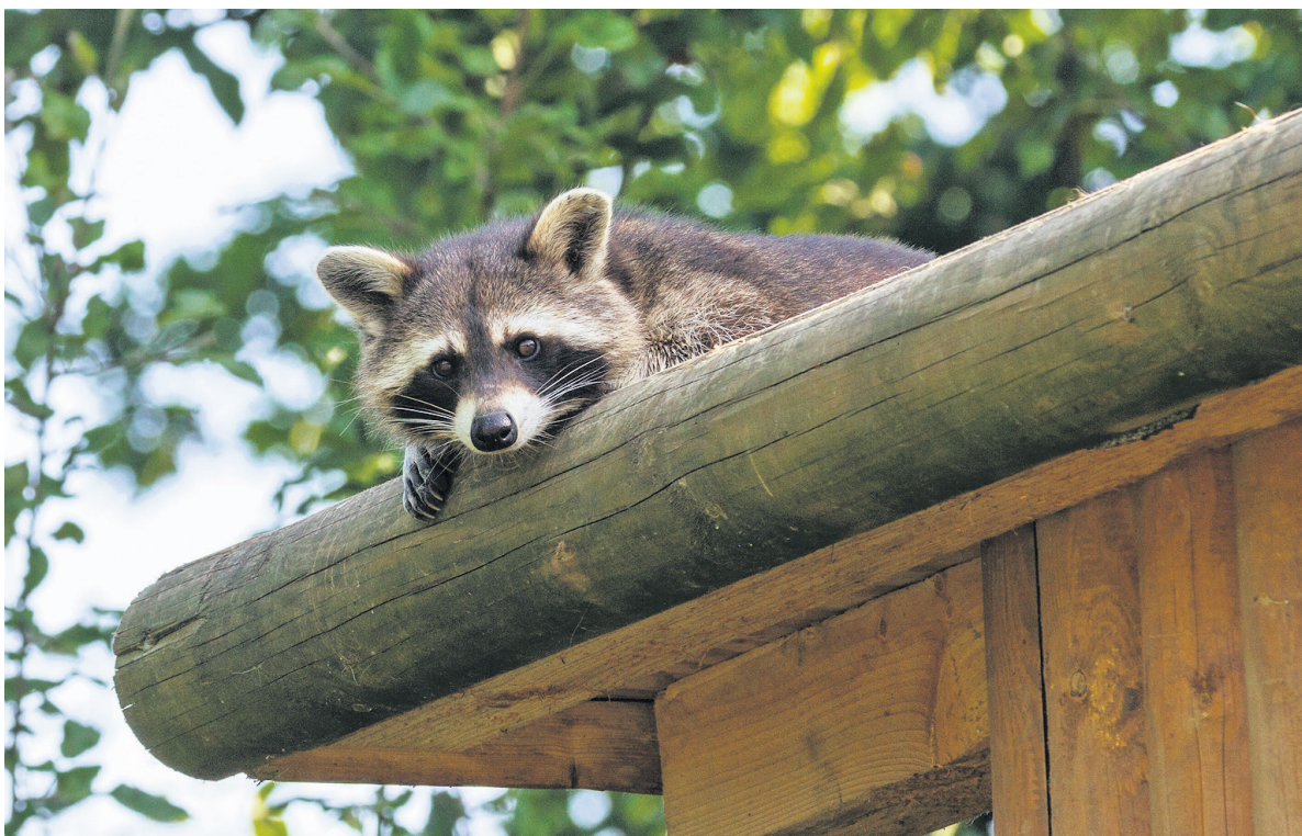
So possierlich sie auch sind: Waschbären können große Schäden anrichten.