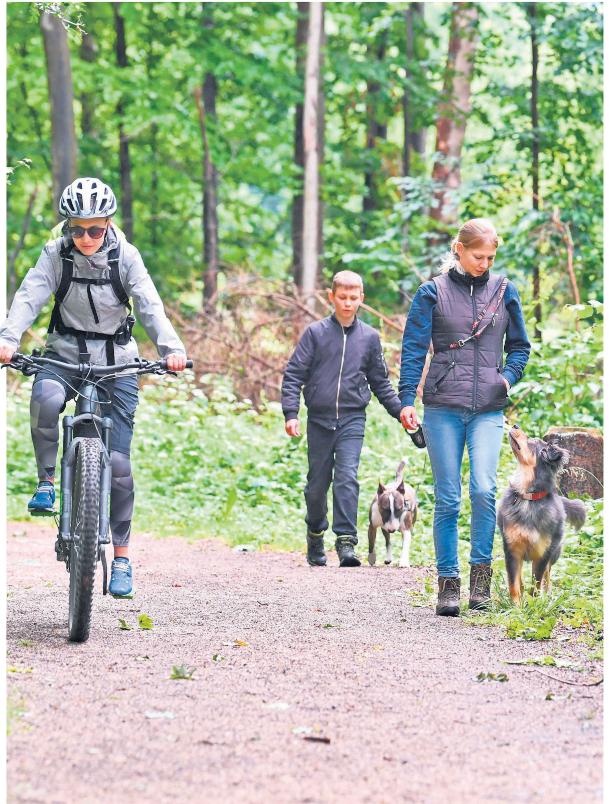
Jetzt beginnt die Brut- und Setzzeit. Während die Tiere im Wald und auf den Wiesen ihren Nachwuchs auf die Welt bringen und aufziehen, ist es um so wichtiger, dass Radfahrer auf den Wegen und Hunde an der Leine bleiben.