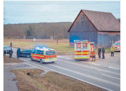
Ein schwerer Unfall sorgte für eine Vollsperrung im Tiefenbachtal.

Nürtingen. Schwere Verletzungen hat eine Fußgängerin bei einem Verkehrsunfall am Donnerstagnachmittag im Tiefenbachtal bei Nürtingen erlitten. Ein 56-Jähriger fuhr gegen 16.45 Uhr mit seinem Audi auf der Kreisstraße in Richtung Owen. Auf einem nahezu geradlinig verlaufenden Streckenabschnitt, etwa einen Kilometer nach dem Ortsende von Nürtingen, lief eine 73 Jahre alte Frau von einem Feldweg über die Kreisstraße. Der Autofahrer konnte trotz eines Ausweichmanövers und einer Vollbremsung den Zusammenstoß mit der aus seiner Sicht von rechts kommenden Frau nicht verhindern. Die 73-Jährige musste nach notärztlicher Versorgung an der Unfallstelle mit einem Rettungshubschrauber in eine Klinik geflogen werden. Der Autofahrer erlitt einen Schock und wurde vom Rettungsdienst versorgt. Am Fahrzeug war ein Schaden in Höhe von etwa 2000 Euro entstanden. In die Ermittlungen der Verkehrspolizei Esslingen wurde ein Sachverständiger eingeschaltet. Die Feuerwehr war mit 13 Einsatzkräften und drei Fahrzeugen an die Unfallstelle ausgerückt. Die Kreisstraße war während der Unfallaufnahme bis etwa 20 Uhr voll gesperrt.