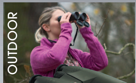
Meostar B1 8x56