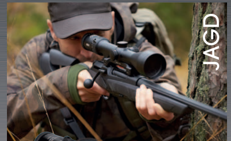
MeoStar R2 RD 2,5-15x56