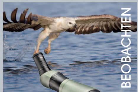
Meopta Spektiv S2 82 HD 45° o. Okular